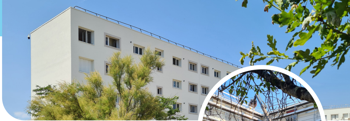
Réhabilitation à Romorantin-Lanthenay et à Contres