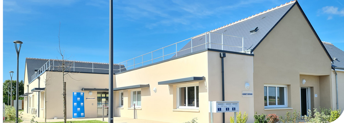
Maison de santé à Pontlevoy - Architecte : Sarl Arteia