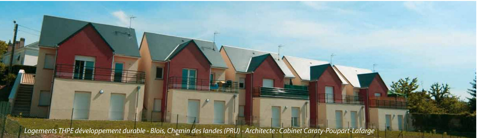
Logements THPE développement durable - Blois, Chemin des landes (PRU) - Architecte : Cabinet Caraty-Poupart-Lafarge