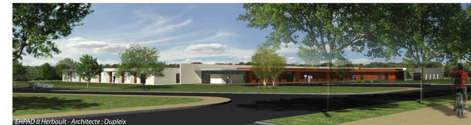
EHPAD à Herbault - Architecte : Duplex

Professionnel de la construction d'hébergements adaptés à des publics spécifiques comme dans la réalisation d'équipements publics, Terres de Loire Habitat est votre interlocuteur de