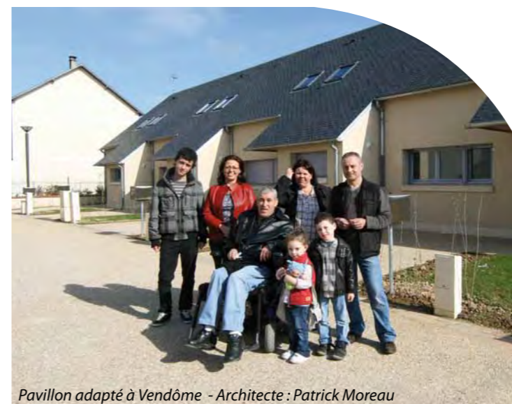
Pavillon adapté à Vendôme - Architecte : Patrick Moreau

Toutefois, l'adaptation des logements existants n'est pas toujours possible ; la construction d'un habitat adapté et proche des services est aussi une alternative nécessaire. Les solutions de logement proposées s'inscrivent dans une politique globale élaborée en partenariat avec le Conseil général et les communes : les logements neufs pour personnes âgées ou handicapées sont proches du centre-ville et des commerces afin de permettre une continuité d'activités relationnelles et ainsi réduire les risques d'isolement.