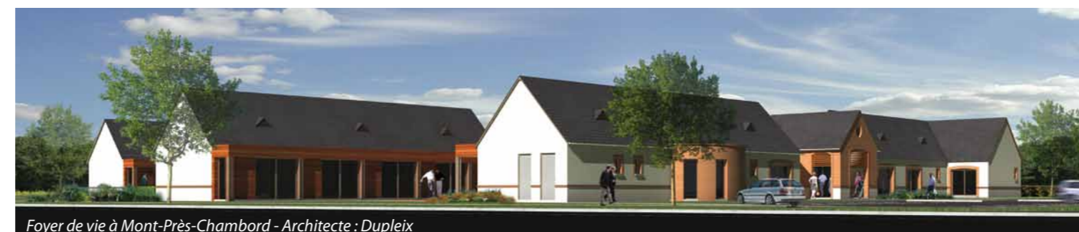
Foyer de vie à Mont-Près-Chambord - Architecte : Duplex

En collaboration avec les collectivités locales et avec l'appui des partenaires financiers, Terres de Loire Habitat réalise des logements adaptés aux besoins spécifiques des familles cumulant plusieurs difficultés. Ces logements, répartis dans le département et bénéficiant de financements PLA insertion et intégration, sont loués à des personnes en grande difficulté. De même, des logements sont réservés à l'hébergement d'urgence , mis à la disposition de différentes associations pour accueillir temporairement des personnes en difficulté, afin de leur permettre de réintégrer un parcours résidentiel. Au-delà de ces solutions d'habitat, Terres de Loire Habitat a également aménagé trois maisons-relais pour le compte d'associations, destinées à l'accueil de publics en situation précaire : à Blois, Saint-Gervais-la-Forêt et Selles-sur-Cher.