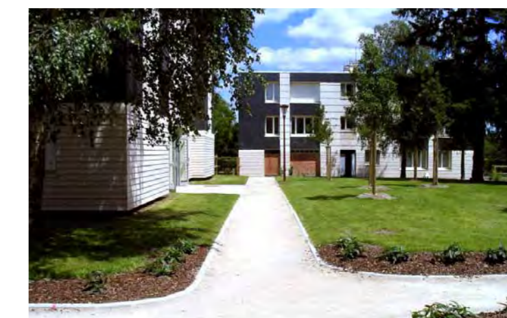
Aménagement à Nouan-le-Fuzelier

Aménager, c'est proposer une réorganisation des espaces pour assurer le mieux vivre de tous. Fort de son expérience dans ce domaine, Terres de Loire Habitat assure une mission d'aménagement pour le compte des collectivités locales.