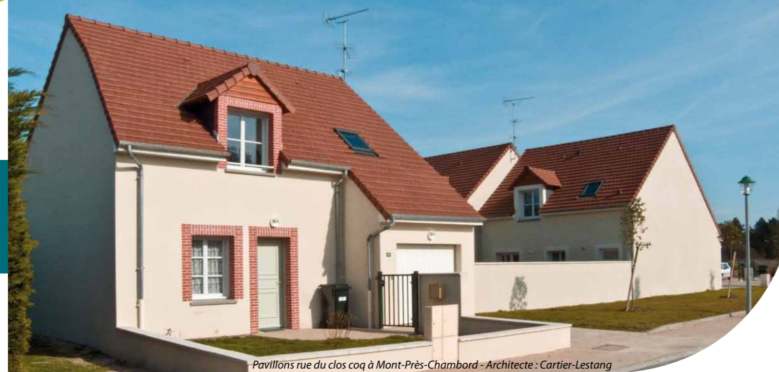
Pavillons rue du clos coq à Mont-Près-Chambord - Architecte : Cartier-Lestang