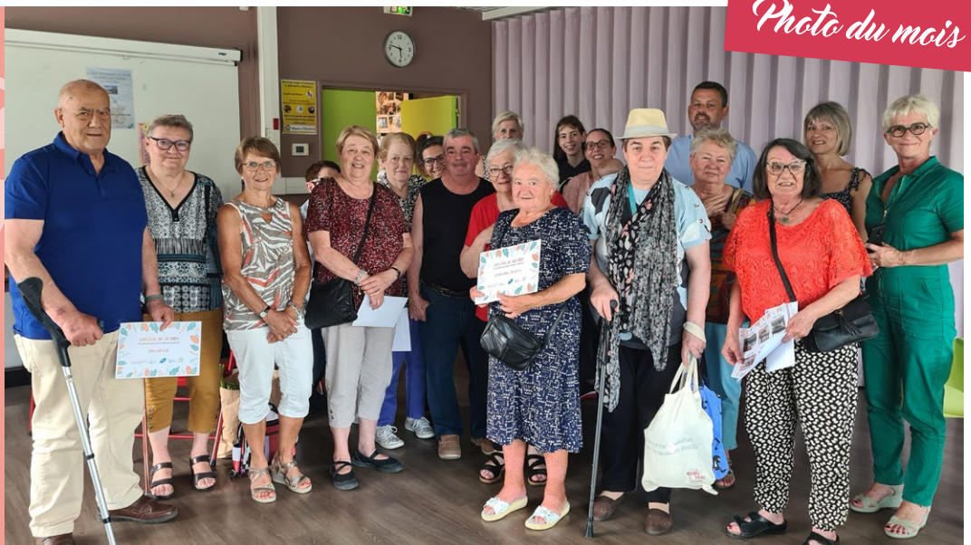
Photo du mois

À Blois, la remise des prix du concours des balcons et jardins fleuris a eu lieu le 7 juillet dernier. Bravo à toutes les participantes!