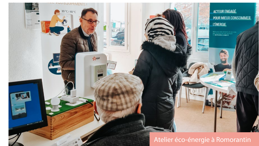
Atelier éco-énergie à Romorantin

Les locataires présents ont pu bénéficier de conseils pour limiter leur consommation et d'explications sur leurs factures d'énergie. Le tout dans la bonne humeur et avec... un stand de crêpes tenu par l'équipe de Terres de Loire Habitat ! Merci d'être venus en nombre !