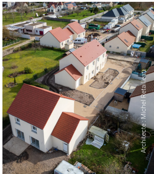
Architecte : Michel Retailleau

Avec la livraison de cinq nouveaux logements fin mars, qui viennent s'ajouter aux dix-huit précédents, Terres de Loire Habitat boucle son programme situé allée de la Salamandre, à Romorantin-Lanthenay. Les pavillons ont été acquis dans le cadre d'une Vente en l'État Futur d'Achèvement (VEFA) réalisée avec le promoteur Cohérences. Ces logements, allant du T3 au T5, bénéficient d'une architecture traditionnelle de qualité. Le coût de l'opération s'élève à 1 006 080 €.