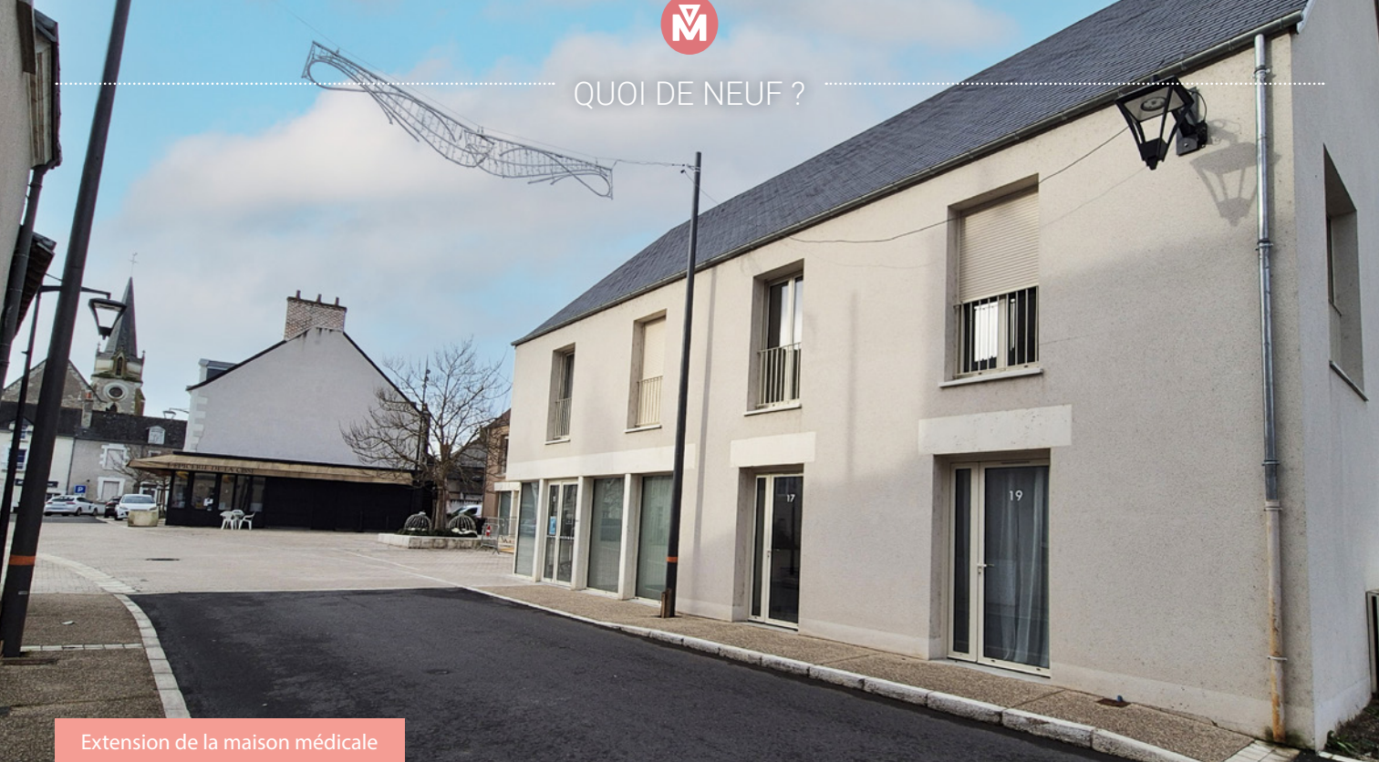
Extension de la maison médicale